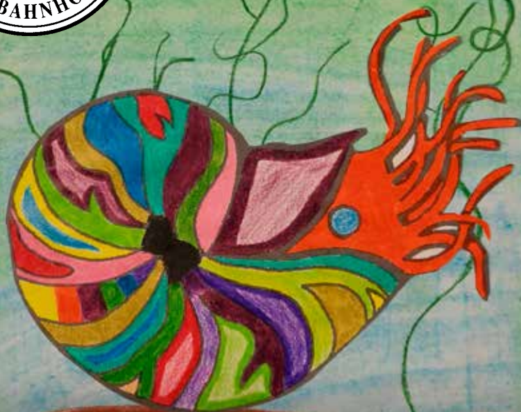
Titelbild: Carlotta Rosenbaum, Klasse 3a Thema: Unterwasserwelten